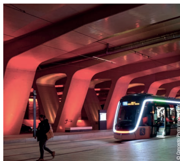
Ouvrage de l'A86 à Vitry.